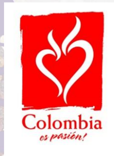
Figura 3. El logo símbolo de la marca país de Colombia. Adaptado de “Informes de la dirección Colombia es Pasión” por Imagen País de Proexport, 2008.

Al respecto, Michael Porter, profesor de Harvard, señala que la pasión es un atributo muy comercializable. Especialmente cuando se trata de temas de negocios, la pasión del pueblo puede demostrar un trabajo duro y resultados positivos. Porter enfatiza que Colombia tiene que ser experimentado sensorialmente. Es un país que permite crear un vínculo emocional rápidamente. (Porter, 2005)